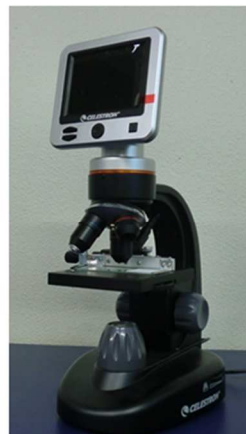
けんびきょう 顕微鏡